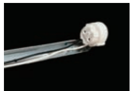
シャーシ型器具 (G13ソケット) 20, 32, 40W型